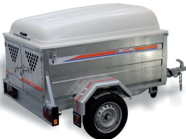
2 puertas + separación interior + bandeja