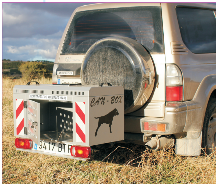
CAN BOX ALU