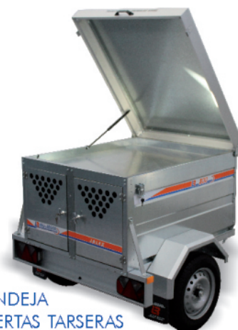
- BANDEJA - PUERTAS TARSERAS