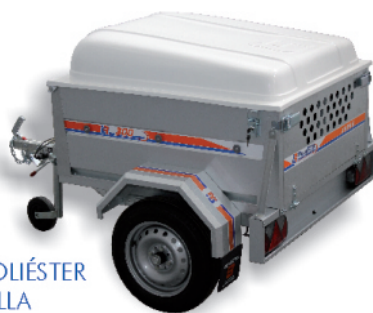
- TAPA POLIÉSTER - TRAMPILLA - RUEDA JOKEY