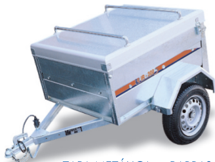
- TAPA METÁLICA + BARRAS