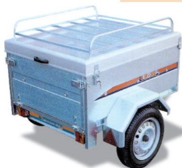
- TAPA METÁLICA + BACA