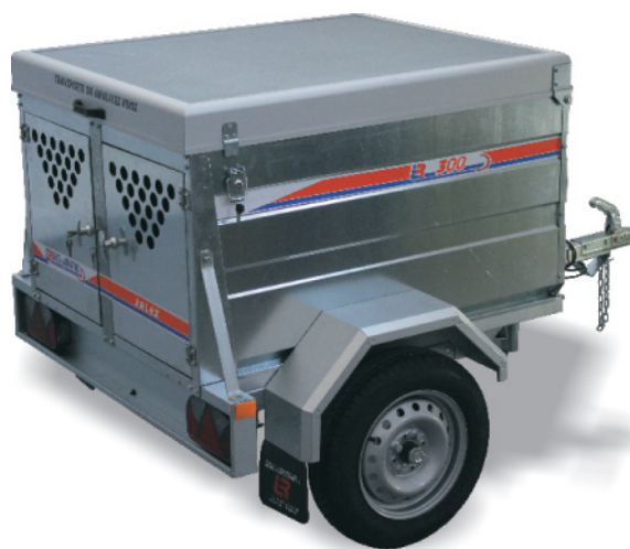
2 puertas + separación interior + bandeja