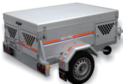
- TAPA METÁLICA - PUERTA LATERAL