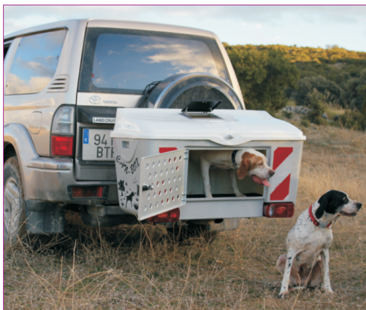
CAN BOX POL