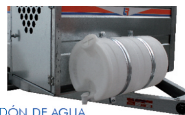
BIDÓN DE AGUA