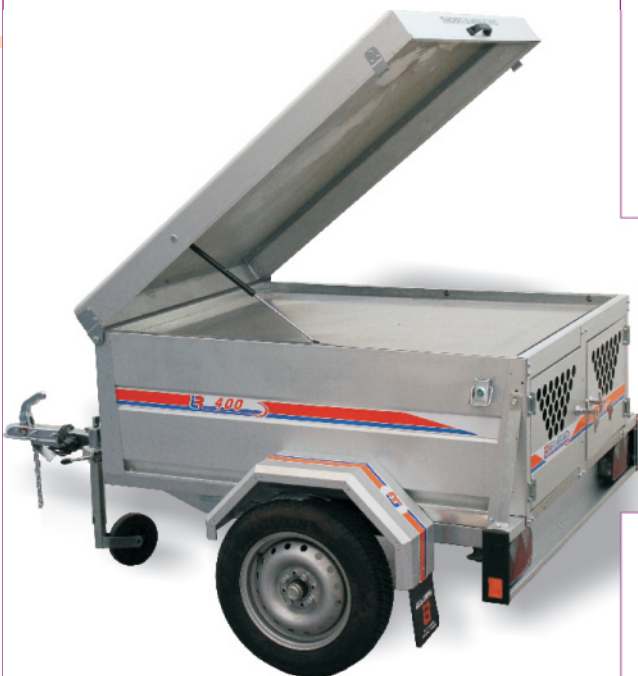
2 puertas + separación interior + bandeja